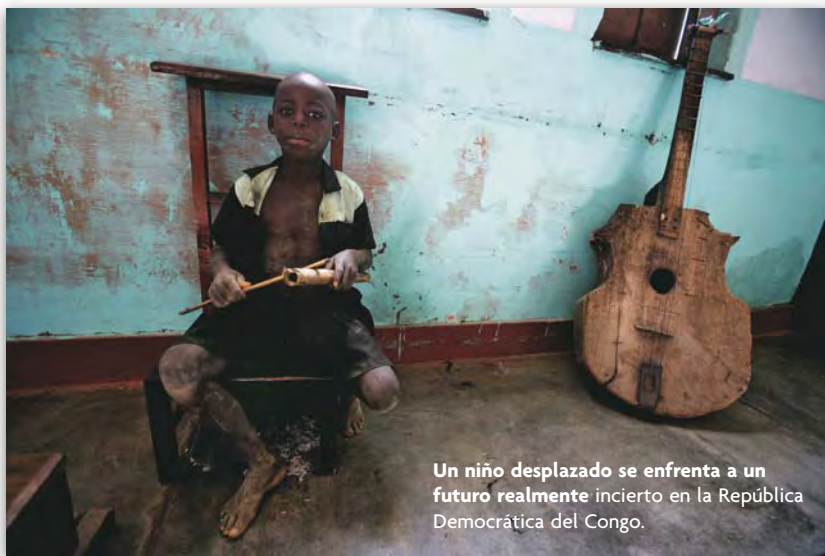
Un niño desplazado se enfrenta a un futuro realmente incierto en la República Democrática del Congo.