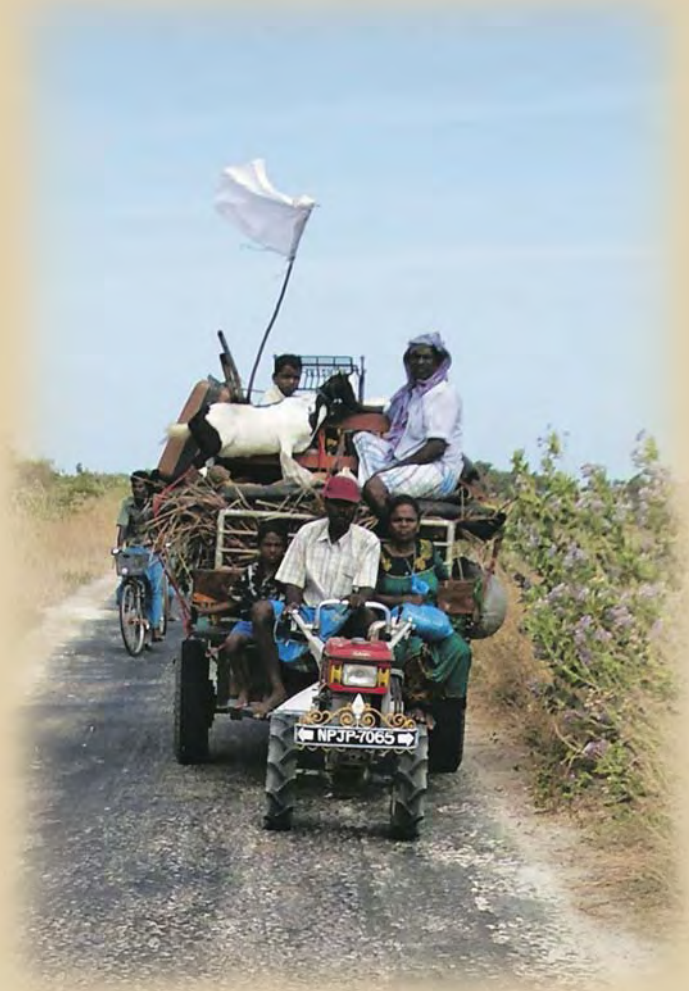
Una familia huye de la reanudación de los combates en la península de Jaffna, Sri Lanka.