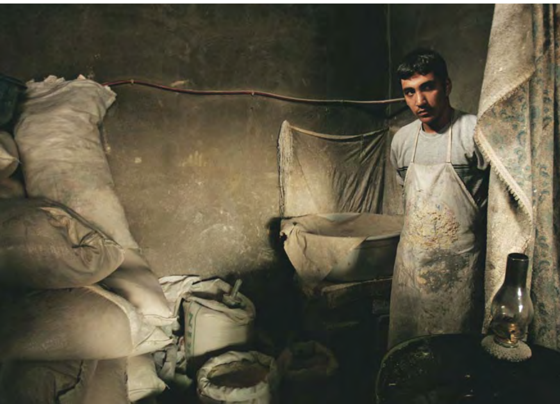
Un iraquí que huyó de los asesinatos y secuestros sectarios apoya a su familia trabajando como panadero en otra parte de Iraq.